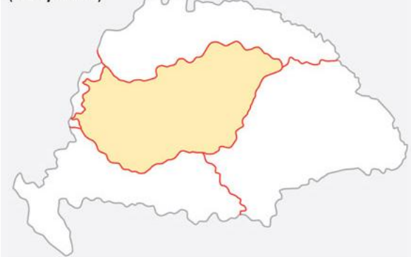
Magyarország felosztása a trianoni békeszerződés szerint (1920. június 4.)