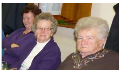
Idősek Napja Iváncon