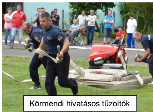
Körmendi hivatásos tűzoltók