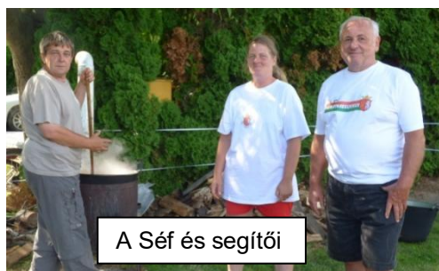
A Séf és segítői