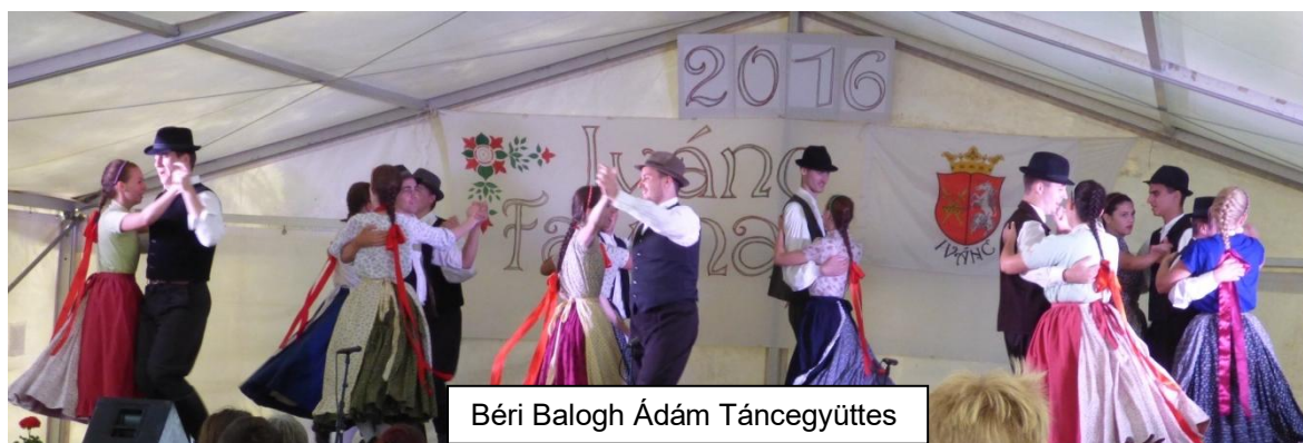
Béri Balogh Ádám Táncegyüttes