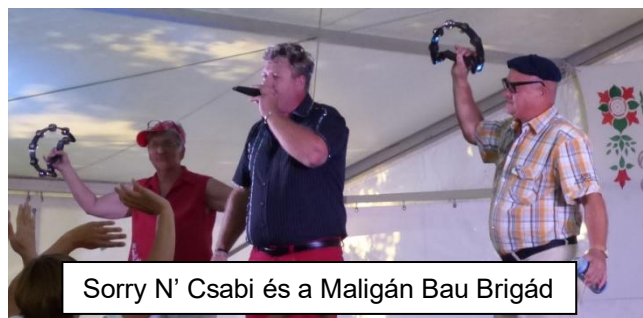
Sorry N' Csabi és a Maligán Bau Brigád