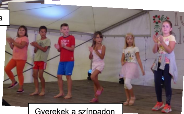
Gyerekek a színpadon