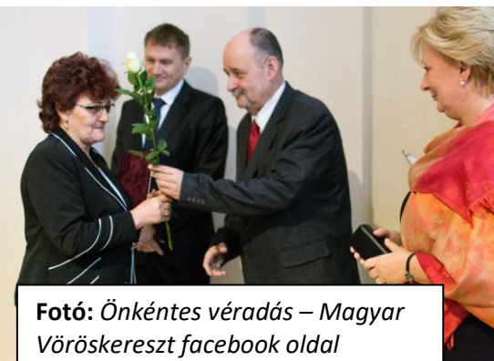
Fotó: Önkéntes véradás

1988-tól kezdődően tartja meg minden év november 27-én a Véralók Napját Magyarországon a Magyar Vöröskereszt. A rendezvényen a többszörös véradókat, a véradásszervezésben részt vevőket, a véradóbarát munkahelyeket és a véradómozgalom támogatóit ünneplik, elismerésben részesítik.